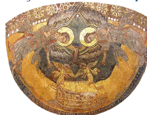
de Germigny-des-Prés dévoilé... trésor lové dans l'abside orientale de l'église