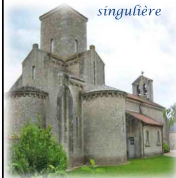
Consacrée au début du IX ème siècle sous Charlemagne !